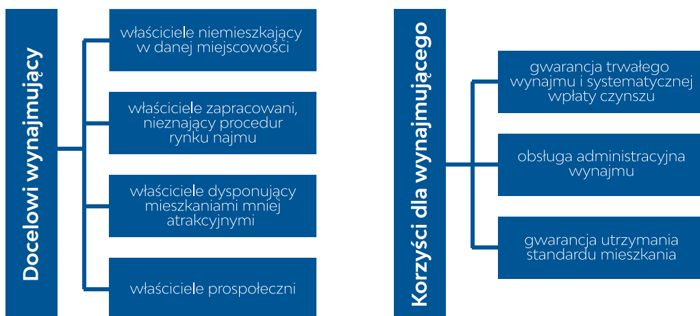
Rysunek 1. Sytuacja właścicieli (potencjalnych partnerów SAN) i korzyści ze współpracy z SAN (uwaga: po dwie grafiki powinny być obok siebie).

Poniżej zaprezentowano podstawy działalności Społecznych Agencji Najmu pod kątem okoliczności sprzyjających korzystaniu z ich usług przez właścicieli mieszkań do wynajęcia (rysunek 1) oraz najemców tych mieszkań (rysunek 2).